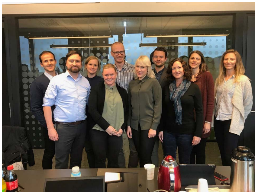
Bilete 1: Studentomboda i Noreg samla i Bergen.

Samarbeid med andre er problematisk når studentombodet samstundes skal vera uavhengig og oppretthalda teieplikta. I ein del tilfelle vil det likevel vera tenleg å samarbeida med andre